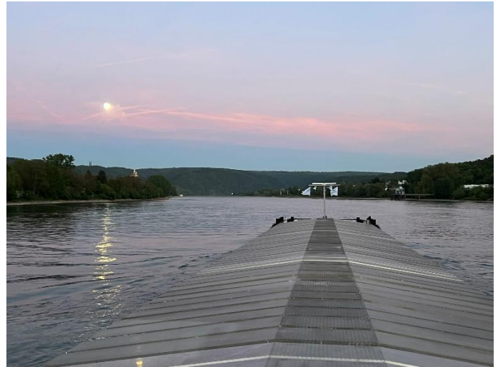
Am Laden in Andernach / Abendstimmung in Rhens

Nachdem wir die notwendigen Ladepapiere, erhalten haben, legen wir ab. Ziel für heute ist Bad Salzig, das wir gegen 23.00 erreichen. Hier gehen wir schlussendlich vor Anker. Ein weiterer arbeitsreicher Tag auf dem Wasser neigt sich dem Ende zu.