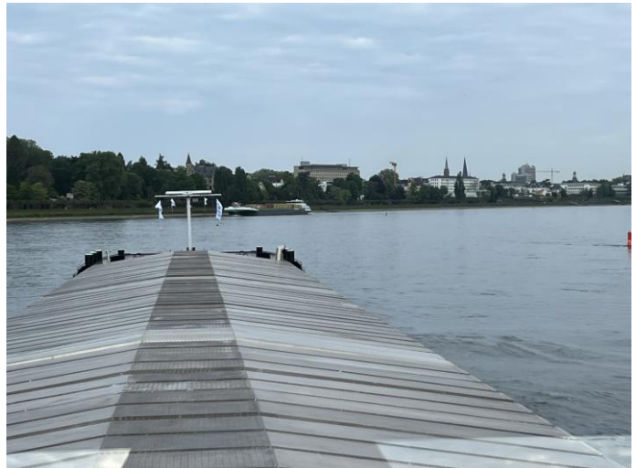
Koblenz mit dem Deutschen Eck / Bonn

Freitag, 08.05.2026 / Neuwied - Duisburg / Wetter: ☁