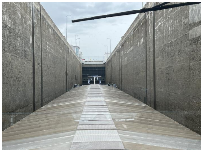
Fertig mit Löschen und zugedeckt / Unterwegs nach Rheinau