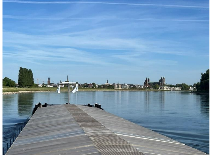
Tschüss Mannheim / Speyer mit dem Kaiserdom

Heute beginnen wir unsere Fahrt mit dem GMS RIO GRANDE um 06:00 Uhr in Mannheim. Der Pegel in Maxau steht bei 4,17 m, und wir haben einen Tiefgang von 2,20 m, was bedeutet, dass wir recht tief geladen sind.