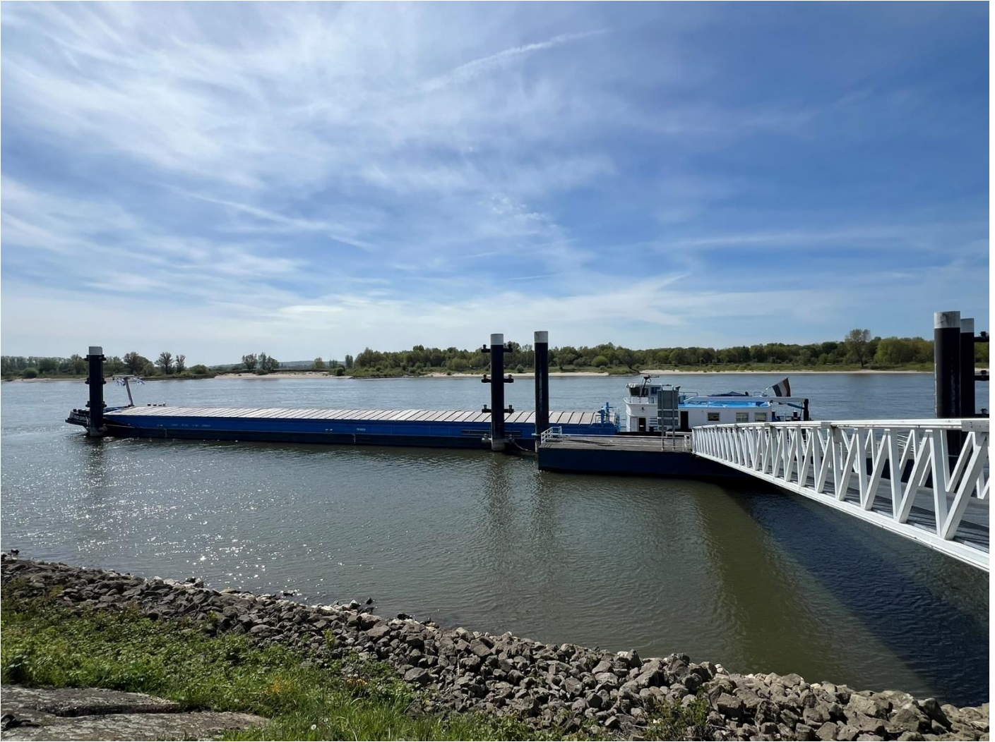
GMS RIO GRANDE in Tolkamer am Autosteiger

Montag, 27.04.2026 / Anreise - Tolkamer - Duisburg / Wetter: ☀️