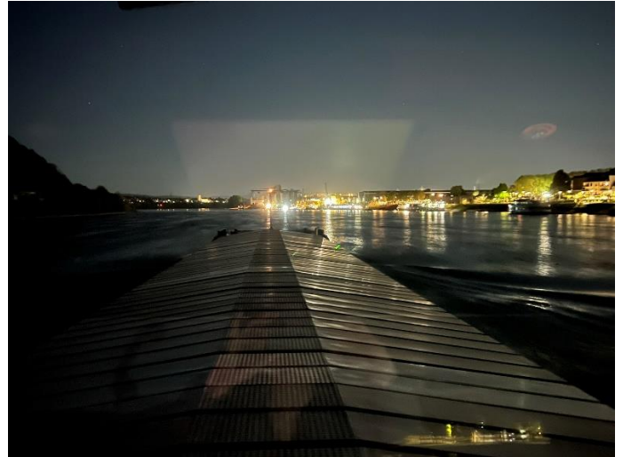
Wir erreichen Koblenz / Andernach, es ist Nacht geworden