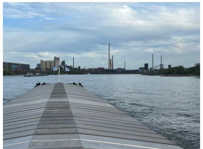
Rees / Wir erreichen das Krupland