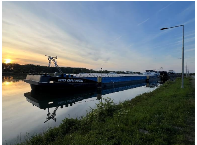
Fähre Plittersdorf / Feierabend im Oberwasser der Schleuse Iffezheim