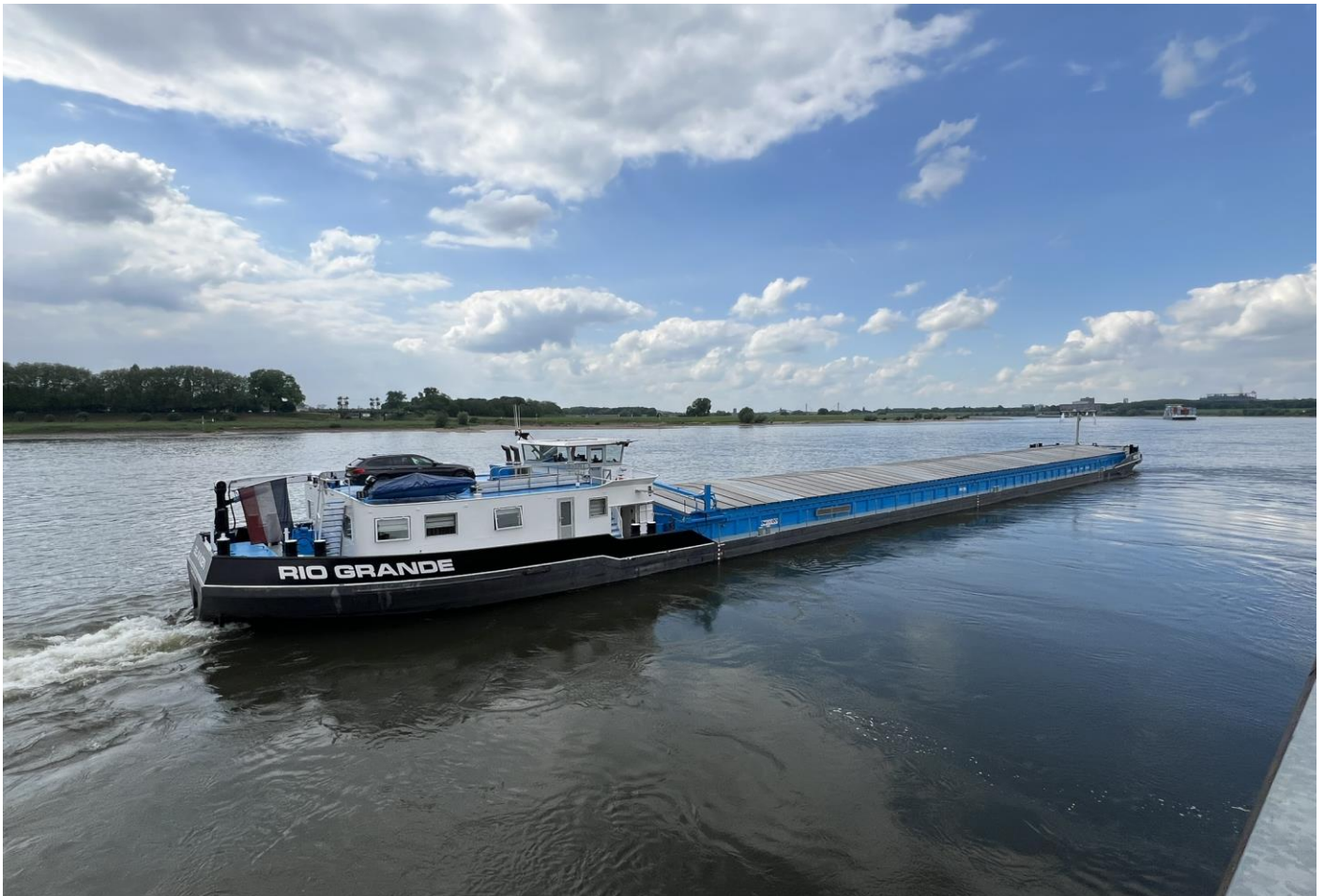
Tschüss GMS RIO GRANDE; gute Fahrt nach Sneek

Dazwischen sprechen wir uns noch kurz ab, und schon stehe ich an Land und winke dem ablegenden Schiff noch kurz zu. So geht alles schnell und schmerzlos, ohne Zeit für große Abschiede oder Sentimentalitäten. Mit dem Taxi geht es zum Bahnhof, und eine Stunde später sitze ich im Zug in Richtung Basel.