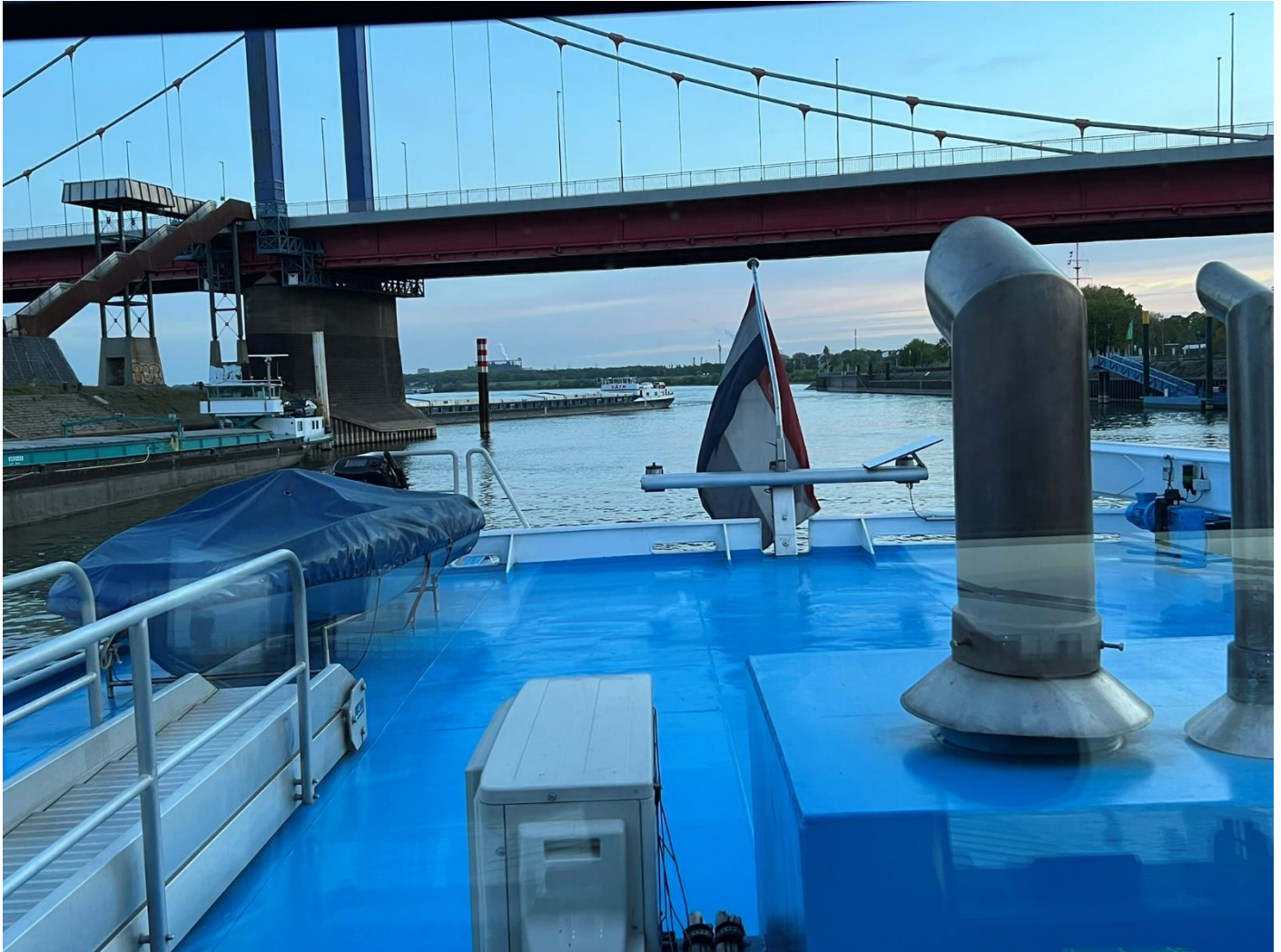
Tschüss Duisburg - Ruhrort

Dienstag, 28.04.2026 / Duisburg - Neuwied / Wetter ☀️