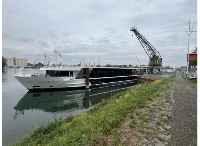
Am Löschen / Passagierboot wartet vor uns auf neue Gäste

Der Fortschritt beim Löschen gestaltet sich relativ langsam, der Kran schmeisst den Lava Sand in einen Trichter, von dort aus geht es über ein Förderband zum Zwischenlager. Leider kommt es häufig zu Verstopfungen des Förderbandes, was den gesamten Prozess hinauszögert. Ursprünglich hatten die Mitarbeiter geplant, bis 16:30 Uhr zu arbeiten. Aufgrund der Verzögerungen wird nun bis 18:00 Uhr gearbeitet.