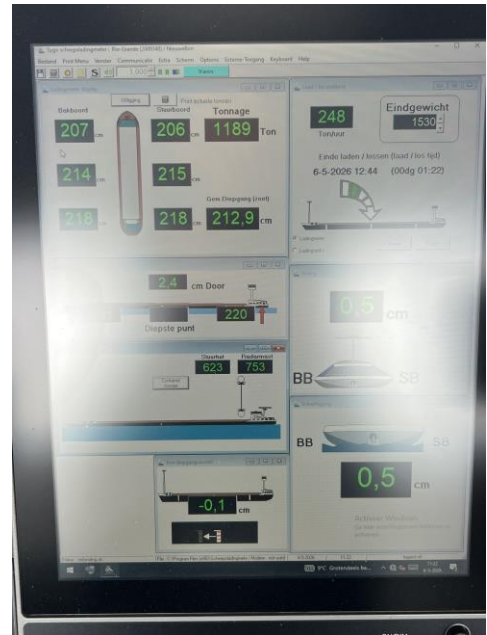
Am Laden / 1150 Tonnen Mais geladen

Um 12.00 Uhr drehe ich das Schiff und die Reise nach Sneek beginnt. Leider klappt es bei den Schleusen nicht optimal. Wir müssen an praktisch jeder Schleuse eine halbe bis ganze Stunde warten, bevor wir geschleust werden.