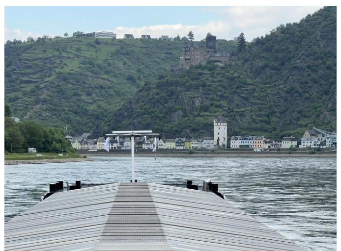
Containershipf MAXINE DEYMANN / St. Goarshausen mit der Burg Katz