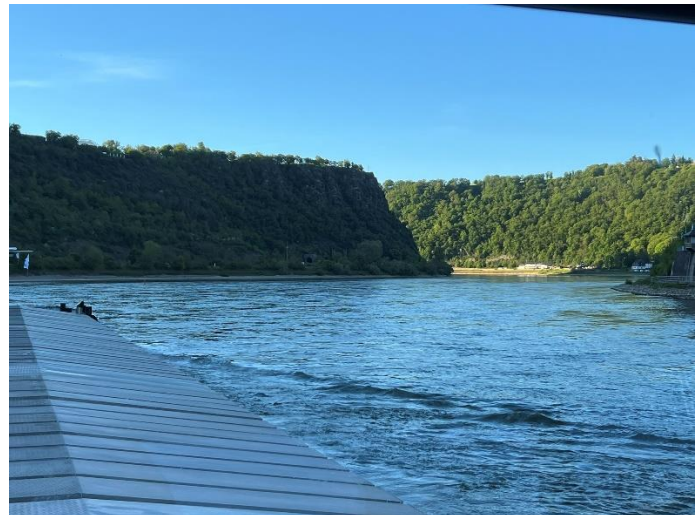
Guten Morgen Bad Salzig / Loreley

Wir drehen unsere Anker um 06:00 Uhr hoch und verlassen Bad Salzig. Ungefähr nach einer Stunde erreichen wir St. Goar und fahren in die berühmte Gebirgsstrecke ein, passieren dabei die Loreley und die anderen markanten Streckenabschnitte. Der Wasserstand ist allerdings niedrig, daher ist beim Navigieren mit einem großen Rheinschiff besondere Vorsicht geboten.