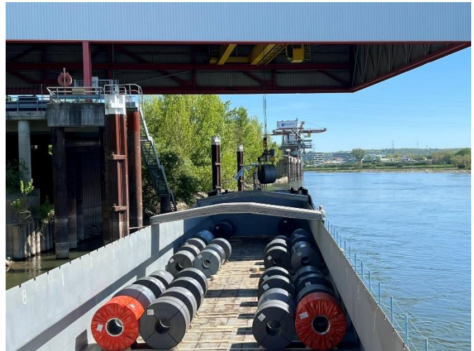
Wir sind am Warten bis der Vordermann fertig ist / Am Löschen