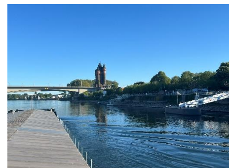
Kaub in Sicht / Mainz / Worms