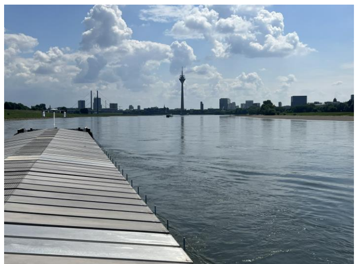
Köln / Düsseldorf